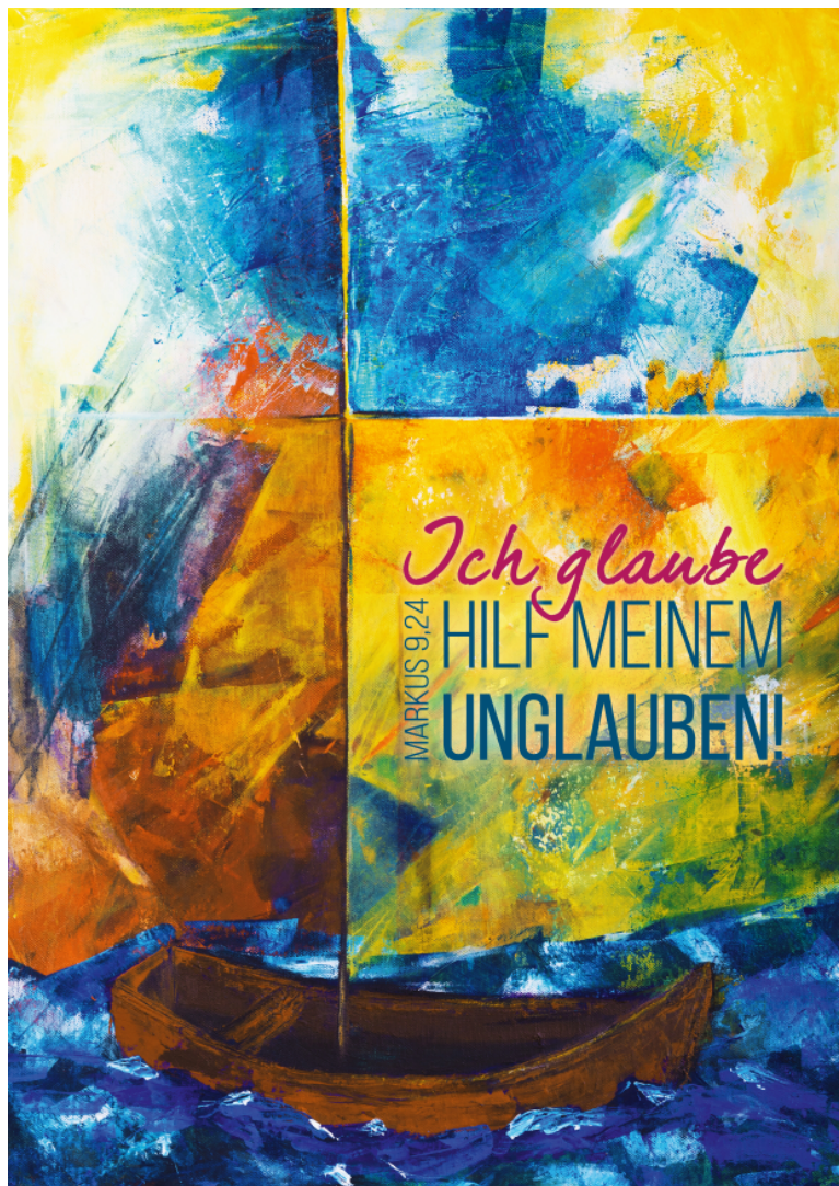
Acryl von U. Wilke-Müller